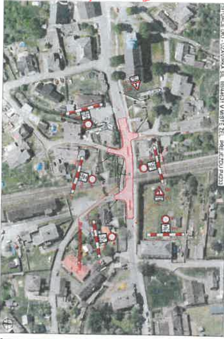
SITUACE DPO - UZAVÍRKA SIL, UMÍSTĚNÍ V MÍSTĚ ČELI, PŘEČTIČKA (P223)