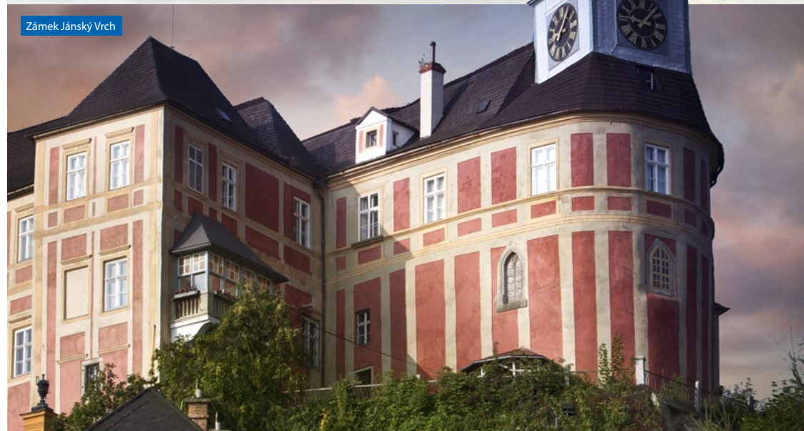
Zámek Jánský Vrch